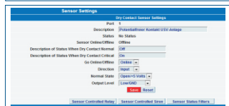
Abb.: Im Webinterface des sensorProbe Monitoringsystems kann der Sensor potentialfreier Kontakt bequem konfiguriert werden. Danach geben Sie die Alarmierungsarten bei Störungsmeldung Ihrer Anlage ein. Zeit- und Wochentagsfilter können auf Wunsch ebenfalls gesetzt werden.

Didactum-Tipp: Sofern Sie eine große Anzahl von potentialfreien Kontakten / Relaiskontakten fernüberwachen möchten, bieten sich die sensorProbe-X20/X60 bzw. securityProbe-X20/X60 Remote-Monitoringsysteme mit jeweils 20 bzw. 60 potentialfreien Eingangs-Kontakten an. Das Bild zeigt die sensorProbe2-X20 DCW mit 48VDC Unterstützung (10128).